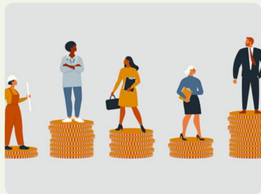
Jeudi 10 septembre La Directive sur la transparence des rémunérations