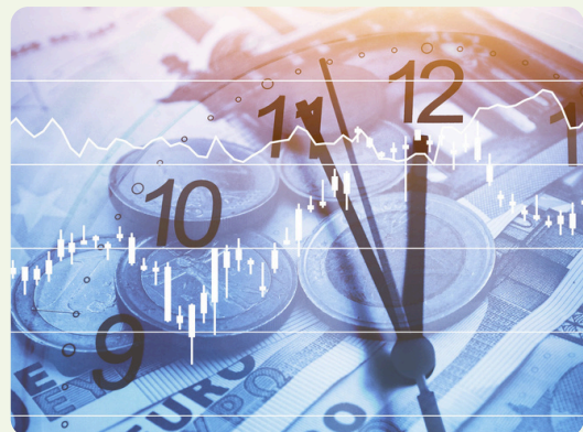
Jeudi 8 octobre Prévenir les risques de retard de paiement et défaillance de clients