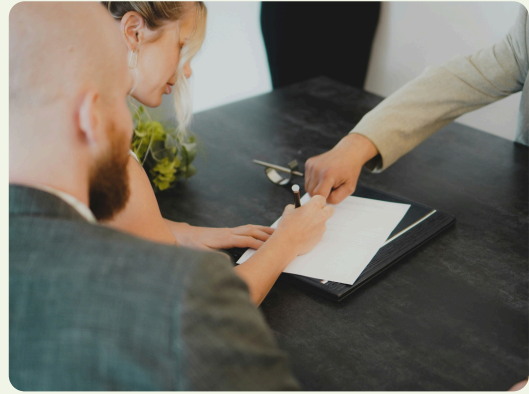
Jeudi 5 novembre Comment sécuriser les ruptures conventionnelles individuelles et collectives ?