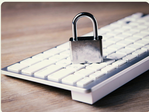
Jeudi 24 septembre RGPD et CNIL