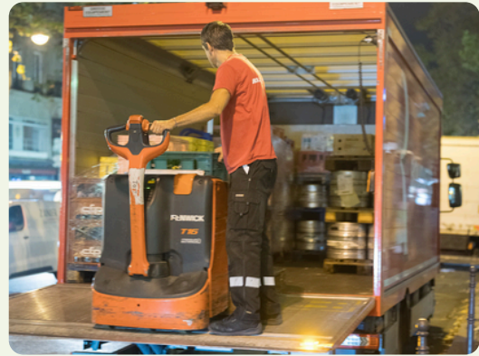
Jeudi 18 juin Règles d'indemnisation des litiges marchandises