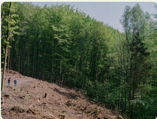
Jeudi 2 juillet Le règlement déforestation : les simplifications