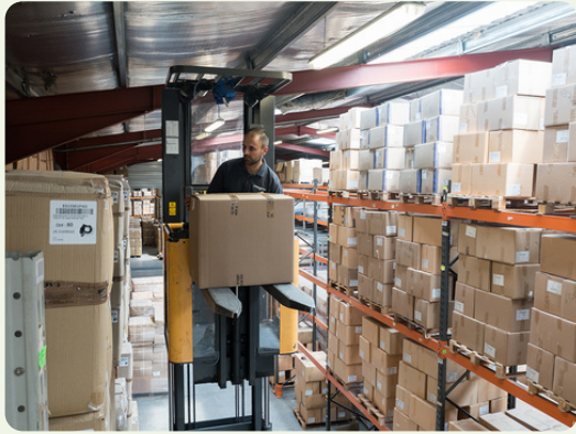
Jeudi 22 octobre La filière REP des emballages professionnels