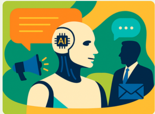
Jeudi 3 décembre L'IA au service de la communication d'entreprise