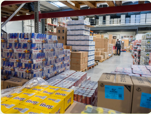
Jeudi 4 juin La filière REP des emballages professionnels