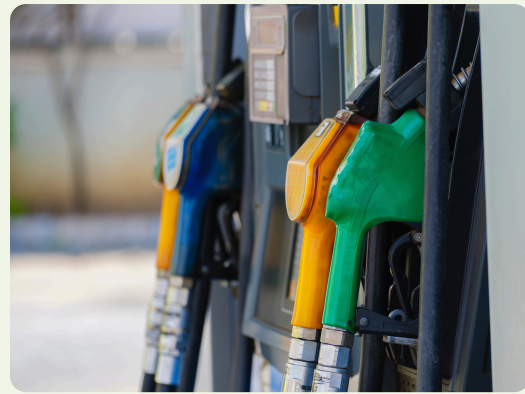
Jeudi 9 avril Dispositif de l'indexation carburant dans le transport routier