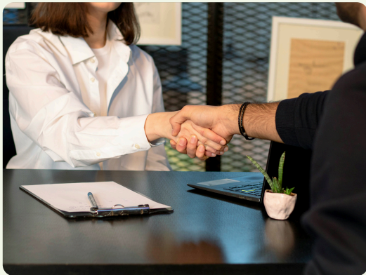
Jeudi 19 novembre Rupture de la relation commerciale établie